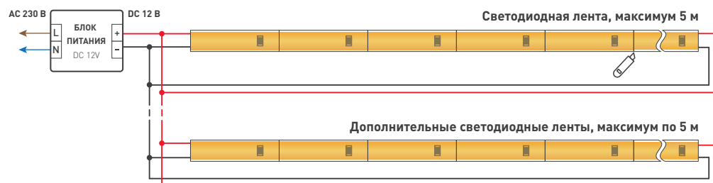
Схема 1. Подключение нескольких светодиодных лент с двух сторон